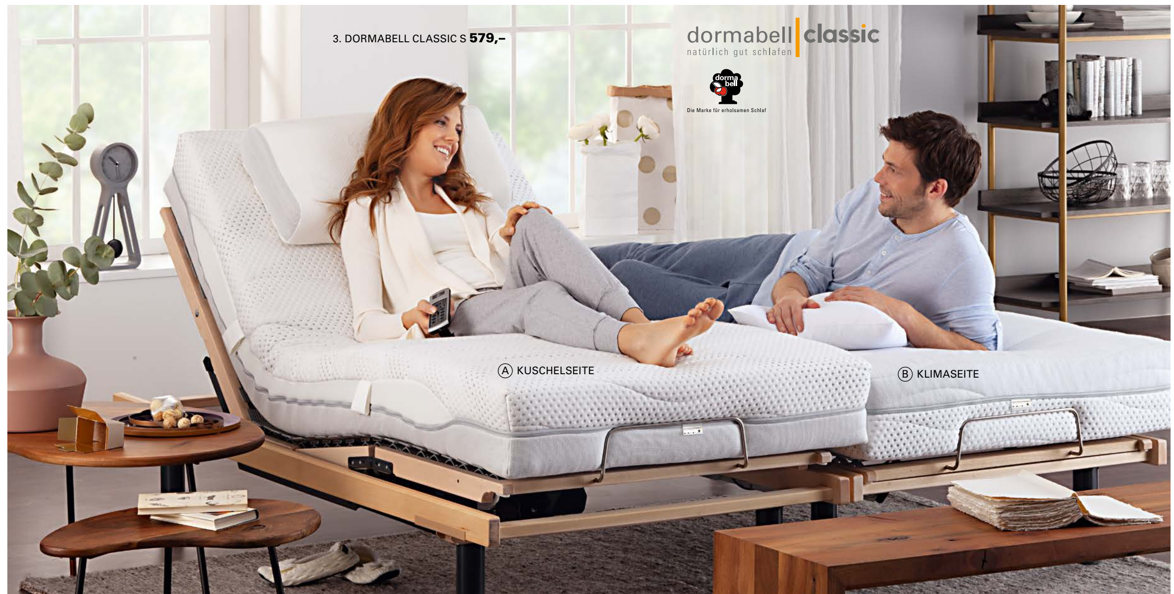
3. DORMABELL CLASSIC S 579,-

dormabell classic natürlich gut schlafen