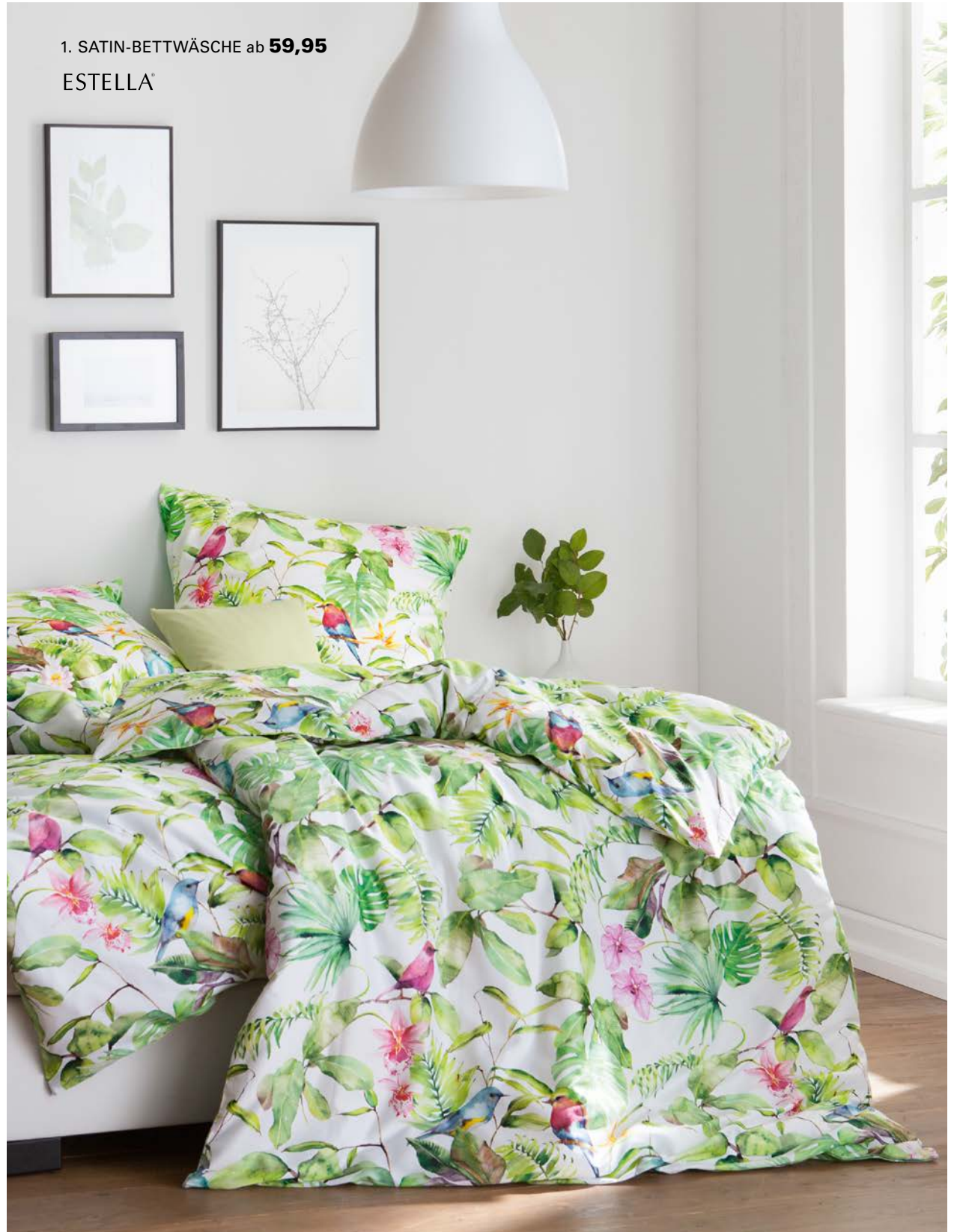
1. SATIN-BETTWÄSCHE ab 59,95 ESTELLA®

1. SATIN-BETTWÄSCHE: So schläft man wie im Dschungel. Eingehüllt in herrlich seidenweichen Satin, bedruckt mit farbenprächtigen exotischen Vogel- und Pflanzenmotiven. Aus 100 % Baumwolle. Mit Reißverschluss. 135 / 200 cm 59,95, 155 / 200 cm 69,95, 155 / 220 cm 79,95. 2. HAMAMTUCH: Weich und leicht mit klassischem Streifenmuster in drei trendigen Farben – so macht dieser Alleskönner nicht nur in der Sauna, sondern auch am Strand eine gute Figur. Aus 100 % Baumwolle. 90 x 180 cm je 15,95.