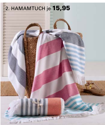
2. HAMAMTUCH je 15,95

FÜR SIE GEFUNDEN: FRISCHE IDEEN FÜR DIE NEUE SAISON!