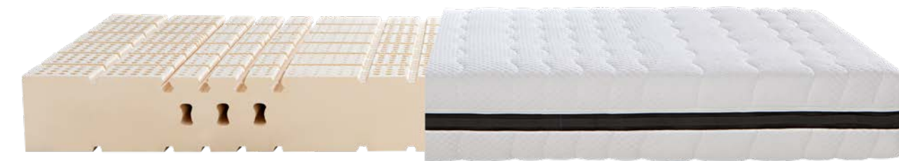
4. DORMABELL CLASSIC L 999,-