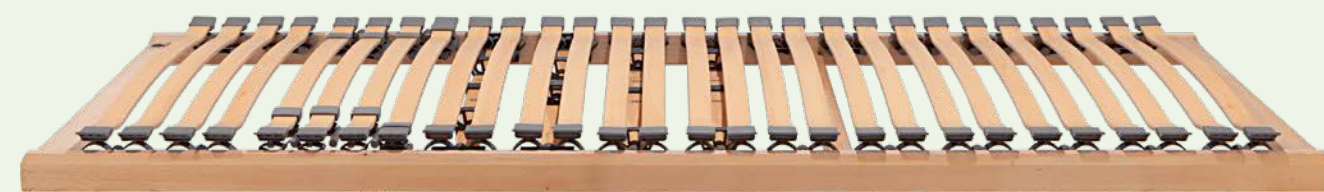
1. DORMABELL CLASSIC N 399,-